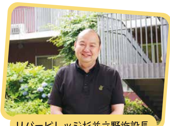
リバービレッジ杉並立野施設長

少し前、チーム内で連携がうまくいかずケアが行き届いていない、と感じることがありました。そこで話し合い、お互いに言って欲しいことを明確にし、コミュニケーションの取り方を見直すことができました。「ありがとう」の感謝の言葉を伝え合うことがモチベーションにもつながっています。これからの課題は、OJTの見直しをして、後輩を育てること。担当者だけでなく、チーム内で役割分担をして新人の気持ちに寄り添っていきたいと考えています。