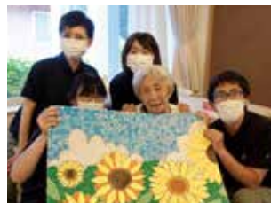
介護チームスタッフ、利用者さんと一緒に。器用な利用者さんが作った千切り絵を持って・・・色々な大作が施設のあちこちに飾ってあり、華やか♪

利用者さんとおしゃべりです。いろいろなことを教えてくださる。昔の暮らし、戦争のはなし、若いときの話・・・旦那さんとこうやって知り合ってね、出会って結婚してね、あなたも早く結婚しなさいよ。なんて言われます 笑 お気に入りの談話スペースのソファでゆっくりお話していると、癒されます。（実際に笑い声があちこちから聞こえてきて、とても楽しい雰囲気でした）